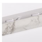
BIANCO CARRARA LUCIDO