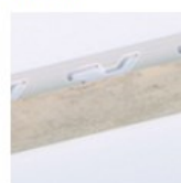
TRAVERTINO GRIGIO SATINATO