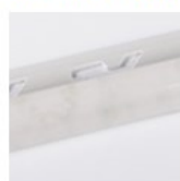
VERDE OLTREMARE LUCIDO