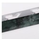
VERDE GUATEMALA LUCIDO