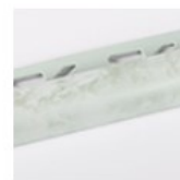
VERDE ACQUA LUCIDO