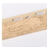
TRAVERTINO OCRA SATINATO