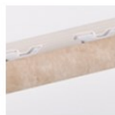
TRAVERTINO NOCCIOLA LUCIDO