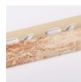
TRAVERTINO BEIGE SATINATO