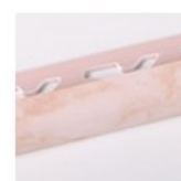
ROSA CHIARO LUCIDO