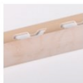
ROSA PORTOGALLO LUCIDO