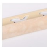
BEIGE CHIARO LUCIDO